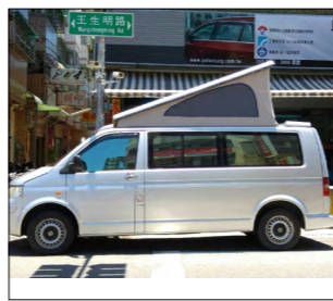
圖 2. 產品成果照 (2)